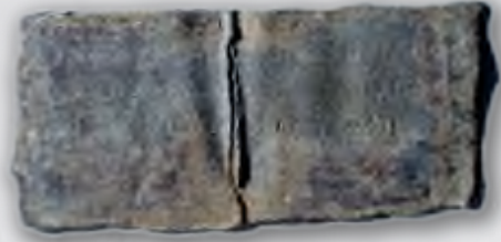
Χρηστήριο ἐλάσμα ἀπὸ τῆ Δωδώνη

«Ἐπερωτῶντι Δωδωναῖοι τὸν Δία καὶ τὴν Διώναν ἢ δι' ἀνθρώπου τινὸς ἀκαθαρτίαν ὁ θεὸς τὸ <v> χειμῶνα παρέχει.»