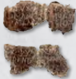
Χρηστήριο έλασμα από τη Δωδώνη

«βροτοῖς πιφαύσκων εἶπε, τὰς δ' αἰνῶν νόσους, σαρκῶν ἐπαμβατῆρας ἀγρίαις γνάθοις λειχῆνας ἐξέσθοντας ἀρχαίαν φύσιν: λευκὰς δὲ κόρσας τῆδ' ἐπαντέλλειν νόσῳ: ἄλλας τ' ἐφώνει προσβολὰς Ἐρινύων ἐκ τῶν πατρῶων αἱμάτων τελουμένας:»